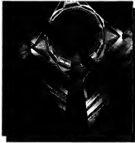
صورة مقياس نهر النيل